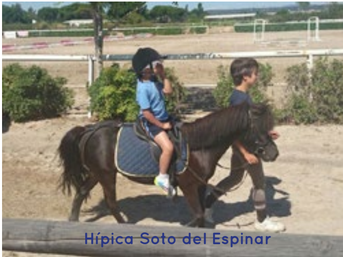
Hípica Soto del Espinar

Más de 175 niños de entre 3 y 8 años han participado este verano en el IV Little Summer Camp del colegio Estudiantes Las Tablas.