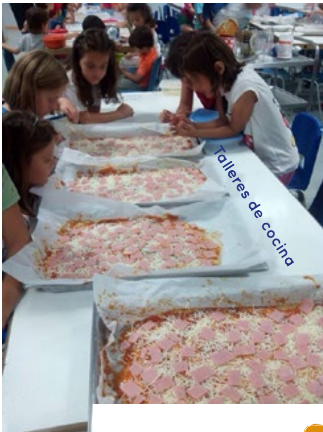
Talleres de cocina