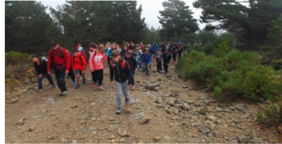
Los alumnos hicieron la ruta desde el Puerto de Cotos hasta el refugio Zabala.

Una actividad al aire libre orientada a que alumnos y profesores se interrelacionen entre sí fuera del aula y establezcan los primeros vínculos del curso en un entorno natural, además de conocer y disfrutar de la fauna y flora de este enclave, en la Comunidad de Madrid.