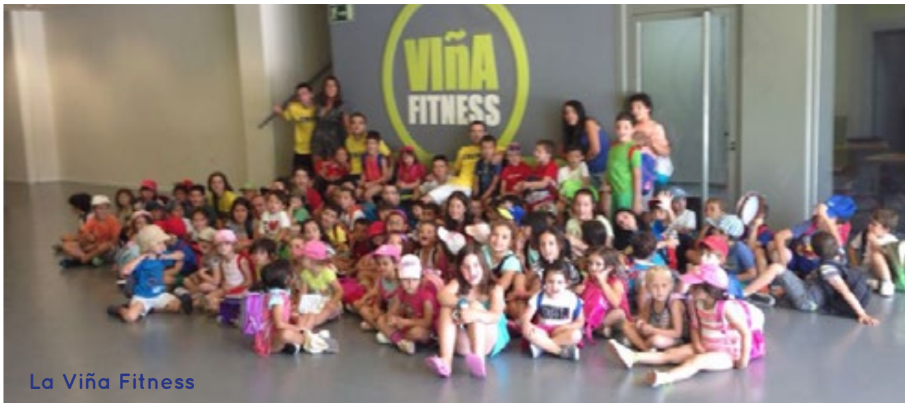
La Viña Fitness